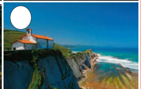
6. Itzurun hondartza (Zumaia)