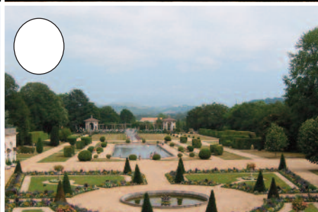
8. Arnagako lorategiak (Kanbo)