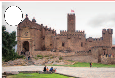
2. Xabierko gaztelua (Zangozako merindatea)