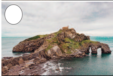
4. Gaztelugatxe (Bakiotik Bermeorako bidean)