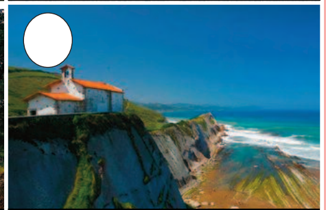
6. Itzurun hondartza (Zumaia)