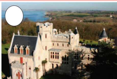
1. Abadia jauregia (Hendaia)