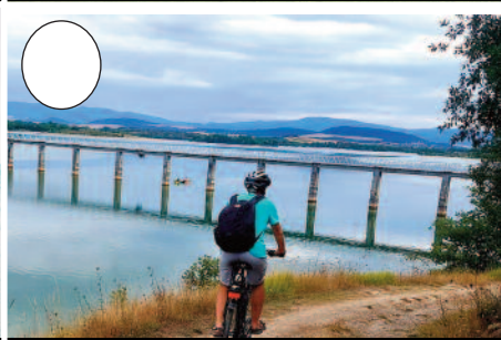
5. Ulibarri-Ganboako urtegia (Legutio ondoan)