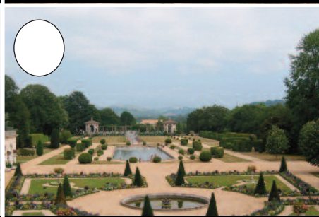
8. Arnagako lorategiak (Kanbo)