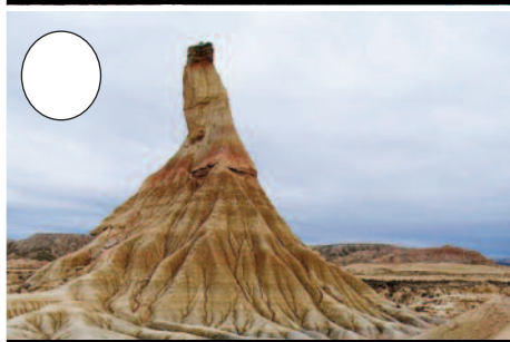
7. Erregeren Bardea (Tuteratik Cadreitako bidean)