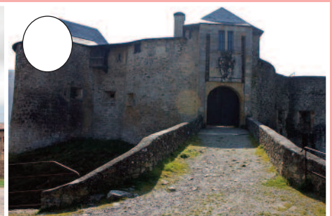
3. Gaztelu Zaharra (Maule-Lexarre)