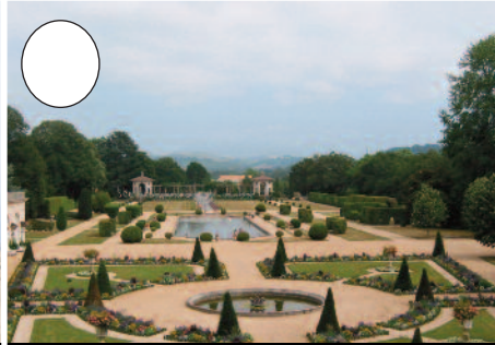
8. Arnagako lorategiak