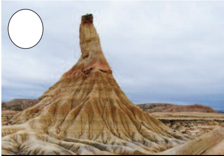
7. Erregeren Bardea