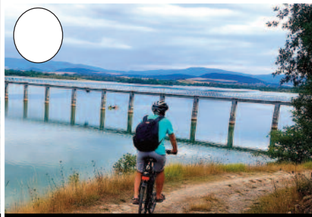
5. Ulibarri-Ganboako urtegia