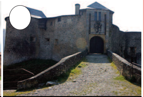
3. Gaztelu Zaharra