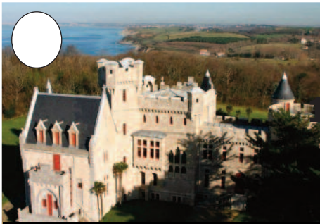
1. Abadia jauregia