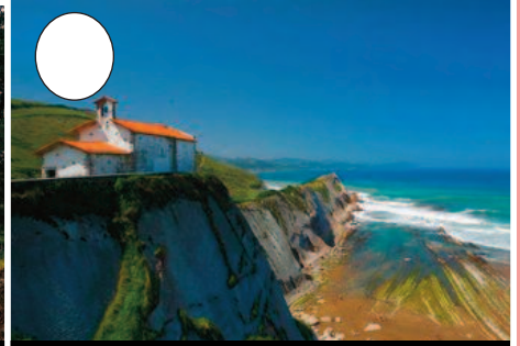
6. Itzurun hondartza