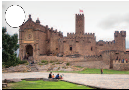
2. Xabierko gaztelua